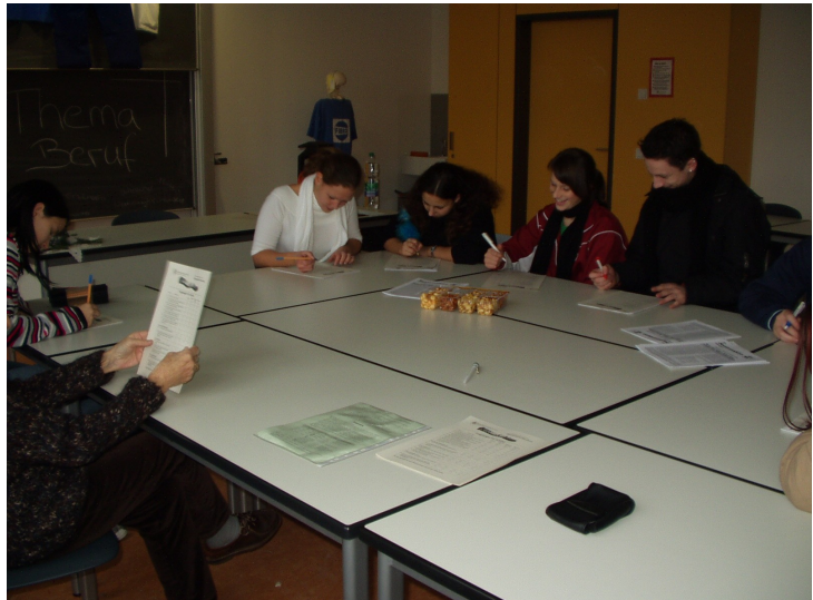
Schüler beim Ausfüllen des Fragebogens.

Es fällt auf, dass es eine überwiegend positive Meinung zum Projekt gibt. Sowohl die Idee und der Informationsgehalt, als auch die Ausführung wurden von den Besuchern positiv angenommen. Die höchste Zustimmung mit 97,6% fand Item 2 („Es ist eine sehr gute Idee, bei diesem Thema Alt und Jung zusammen zu bringen“). Das zentrale Item 5 („Das eher negative Bild des Alters lässt sich durch so eine Aktion positiv beeinflussen“) wurde von 81,5% der Besucher positiv beantwortet und sogar 85,5% wünschten eine Wiederholung des Projekts (Item 6).